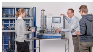
Mechanika tekutin GUNT

Vizualizace proudění v potrubí, měření profilu průtoku, vizualizace aerodynamického tvaru, rovnice kontinuity, měření sil trysky, volný výtok tekutiny, Bernoulliho zákon, ztráty v potrubních elementech, základy tření v potrubí, tlaková křivka v oblasti přítoku, otevřený průtok