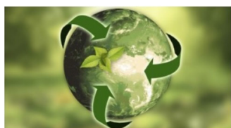
Šetrné k životnímu prostředí